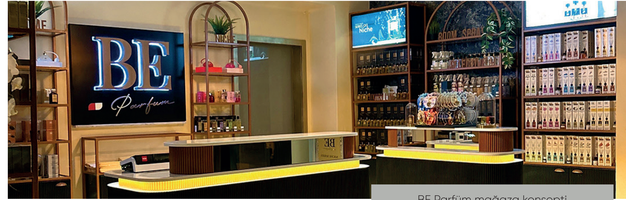
BE Parfüm mağaza konsepti

TÜRKİYE'NİN 25 FARKLI ŞEHRİNDE 50'DEN FAZLA MAĞAZA.